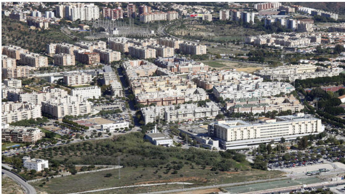
Vista del Hospital Clínico y su entorno.

SEBASTIÁN SÁNCHEZ Málaga, 14 Enero, 2020 - 14:00h