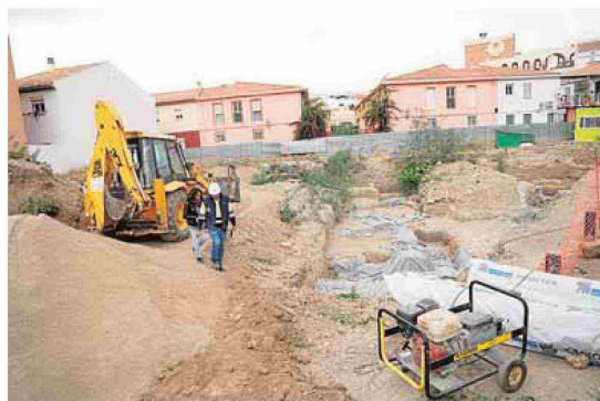
Ya ha empezado la actividad en la parcela.