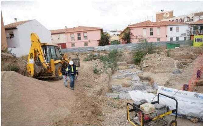
Ya ha empezado la actividad en la parcela.

El proyecto, que supone una inversión de diez millones de euros, estará finalizado para principios del año 2021