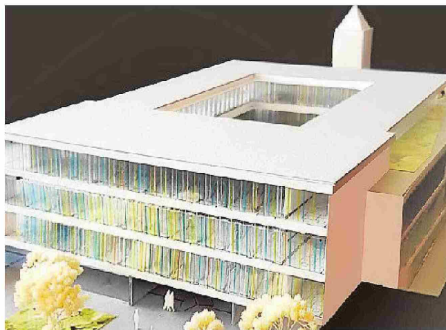
Proyecto de la nueva residencia estudiantil en Sevilla