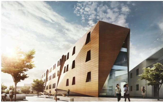
Recreación del proyecto de la residencia entre las calles Cerrojo y Agustín Parejo.

El proyecto, que supondrá una inversión de unos diez millones de euros, ofrecerá 143 habitaciones individuales